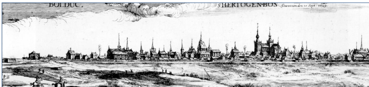
's-Hertogenbosch, 1 e helft 17 e eeuw.